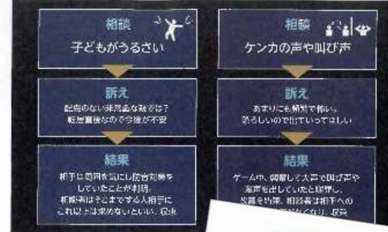
●ヴァンガードスミスで収束に導いてきた事例

由からトラブルが発生した際に連絡を受け、ヴァンガードスミスを実施。トラブル解決支援を行っている