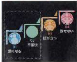
●早期介入でトラブルを収束へ